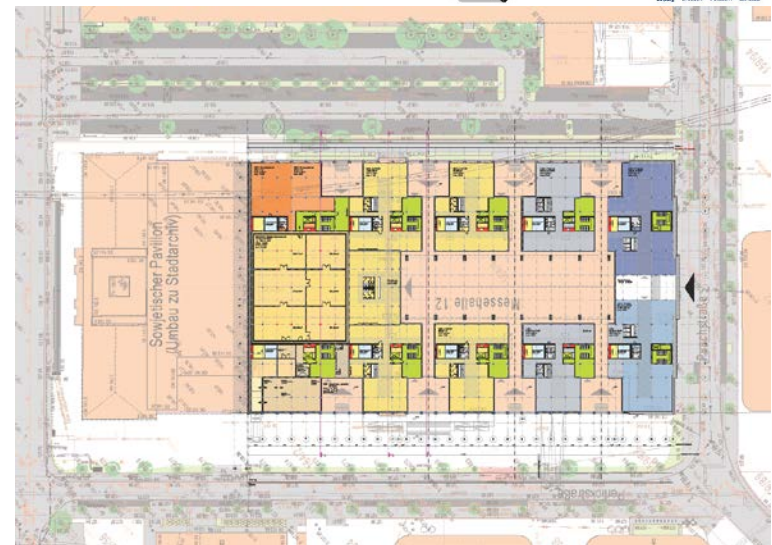
S&P Planungsgesellschaft für Bauwesen mbH Leipzig · Chemnitz · Potsdam · Berlin